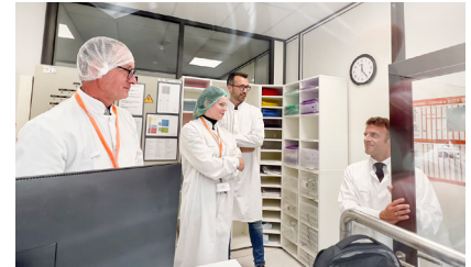
Emmanuel Macron, président de la République, lors de sa visite au laboratoire Aguetant, le 13 juin en Ardèche.

8 nouveaux projets de relocalisation seront lancés dans les semaines à venir, ainsi qu'une feuille de route pour renforcer ces efforts de prévention de pénuries.